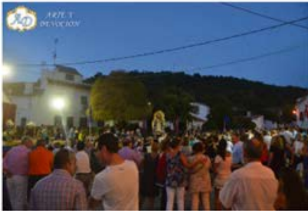
BARRIOS 2016 – Calvario-Navas