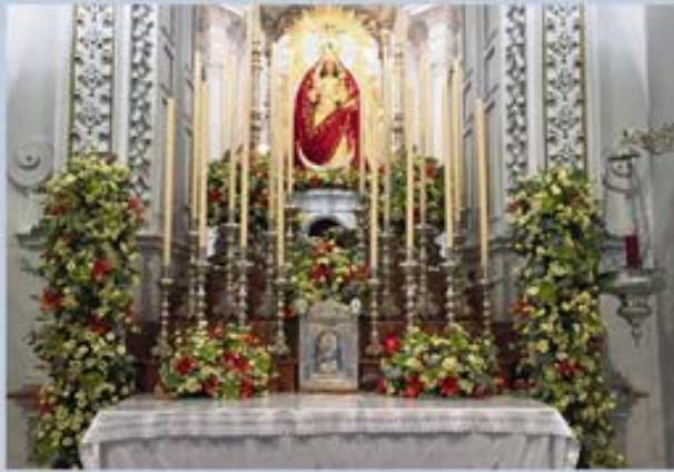
ALTAR NOVENA 2016