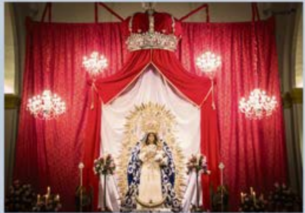
NOVENA septiembre y BESAMANOS 2016